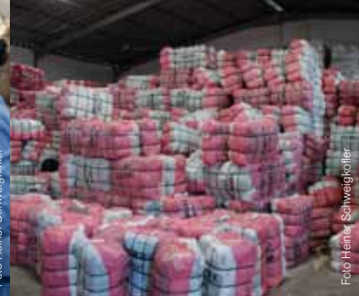
Die sortierten Kleider werden zum Weiterverkauf in Ballen gepresst.