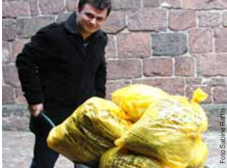
3.000 Freiwillige sammeln am 6. November die Gebrauchtkleider ein.